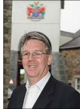
Dyfed Edwards Leader – Gwynedd Council

Unwaith eto, hoffwn ddatgan diolch i fy nghyd aelodau ac i staff y Cyngor am eu hymroddiad a'u hymdrechion i sicrhau ein bod yn parhau i fod yn gyngor gydag uchelgais i gyflawni a hynny o fewn amgylchiadau cynyddol anodd.